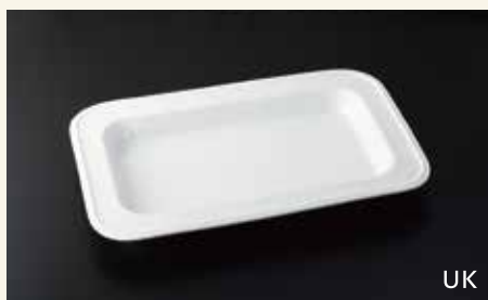
16吋用角フードパン 42.5×28.5×4 ¥7,800 中箱6入