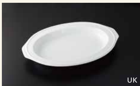
15.5吋用小判フードパン 42.5×30×5 ¥7,800 中箱6入