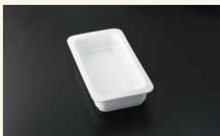
バンケットディッシュ1/3 6.5cm 32.5×17.5×6.5 ¥4,400 中箱6入