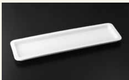
バンケットディッシュ2/4 2.5cm 53×16×2.5 ¥6,000 中箱8入