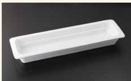
バンケットディッシュ2/4 6.3cm 53×16×6.3 ¥7,300 中箱6入