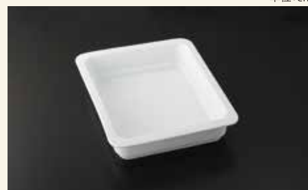
バンケットディッシュ1/2 6.5cm 32.5×26.5×6.5 ¥6,500 中箱6入