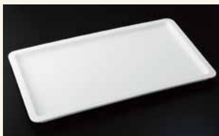
バンケットディッシュ1/1 2.5cm 53×32×2.5 ¥8,300 中箱4入