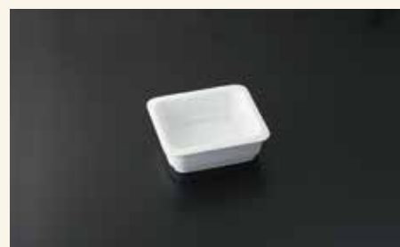
バンケットディッシュ1/6 5.5cm 17×16×5.5 ¥1,700 中箱12入