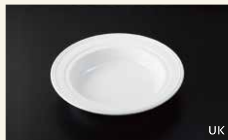
13吋用丸フードパン 35.3×5.5 ¥7,800 中箱6入

※掲載価格は一個価格です。価格に消費税は含まれておりません。陶磁器の性質上、掲載の商品は色・サイズが実物と多少異なる場合がございます。予告なく仕様等が変更、もしくは取扱いが中止される場合があります。あらかじめご了承ください。