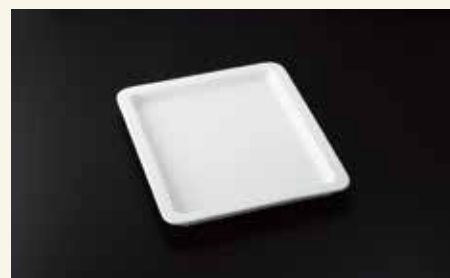
バンケットディッシュ1/2 2.5cm 32.5×26×2.5 ¥5,800 中箱8入