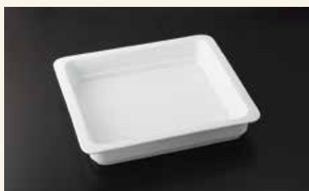
バンケットディッシュ2/3 6.0cm 35.5×32.5×6.0 ¥7,300 中箱4入