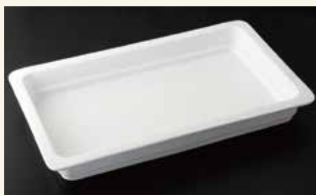
バンケットディッシュ1/1 6.5cm 53×32.5×6.5 ¥8,900 中箱3入